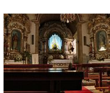
Igreja Matriz de Loriga - vista interior.

Uma tradição muito antiga e documentada, aponta Loriga como berço de Viriato, e já houve na vila um projecto que não chegou a concretizar-se, para erigir um monumento a este heroi lusitano.