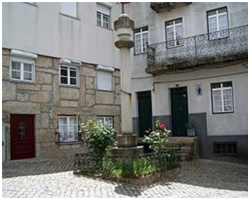
Largo do Pelourinho.