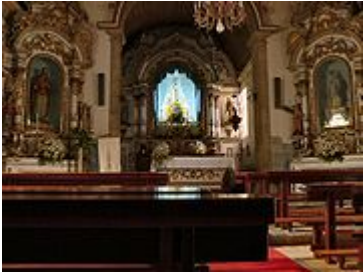
Igreja Matriz de Loriga - vista interior.

igreja, cujo orago era já o de Santa Maria Maior e que se mantém, foi construída no local de outro antigo e pequeno templo, do qual foi aproveitada uma pedra com inscrições visigóticas, que está colocada na porta lateral virada para o adro. De estilo românico, com três naves, e traça exterior lembrando a Sé Velha de Coimbra, esta igreja foi destruída pelo sismo de 1755 , dela restando apenas partes das paredes laterais.