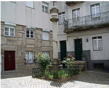
Largo do Pelourinho.

Loriga é uma vila industrial (têxtil) desde a primeira metade do século XIX, mas essa atividade têxtil já existia em moldes artesanais no XIV. Chegou a ser uma das localidades mais industrializadas da Beira Interior, e a actual sede de concelho só conseguiu suplantá-la quase em meados do século XX. Tempos houve em que só a Covilhã ultrapassava Loriga no número de empresas. Nomes de empresas, tais como: Regato, Redondinha, Fonte dos Amores, Tapadas, Fândega, Leitão & Irmãos, Augusto Luis Mendes, Lamas, Nunes Brito, Moura Cabral, Lorimalhas, etc, fazem parte da rica história industrial desta vila. A principal e maior avenida de Loriga tem o nome de Augusto Luís Mendes, o mais destacado dos antigos industriais loriguenses. Apesar dos maus acessos, que se resumiam à velhinha estrada romana de Loriga, com dois mil anos, o facto é que os loriguenses transformaram Loriga numa vila industrial.