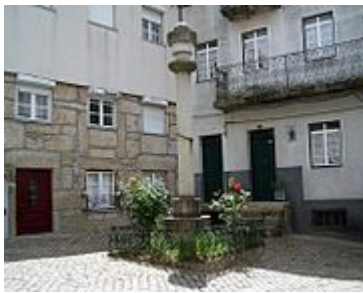
Largo do Pelourinho.