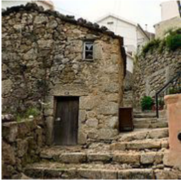
Rua da Oliveira

Loriga celebrou um acordo de geminação com a vila, actual cidade , de Sacavém , em 1 de Junho de 1996 .