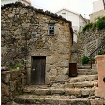
Rua da Oliveira

Loriga celebrou um acordo de geminação com a vila, actual cidade , de Sacavém , em 1 de Junho de 1996 .