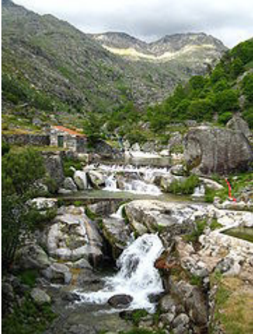
Praia fluvial de Loriga, no local conhecido há séculos por Chão da Ribeira".

facto de este bairro dever o nome a São Gens , um santo de origem céltica martirizado em Arles, na Gália, no tempo do imperador Diocleciano, orago de uma ermida visigótica situada na área, no local onde hoje está a capela de Nossa Senhora do Carmo. Com o passar dos séculos os loriguenses mudaram o nome do santo para São Ginês. Este núcleo da povoação, que já esteve separado do principal e mais antigo, situado mais abaixo, é anterior à chegada dos romanos.