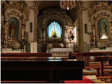
Igreja Matriz de Loriga - vista interior.

Uma antiga tradição profusamente documentada aponta Loriga como berço de Viriato, tendo havido um projeto nunca concretizado de erigir um monumento a esse herói lusitano.