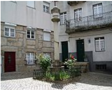
Largo do Pelourinho.