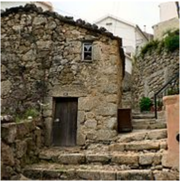
Rua da Oliveira