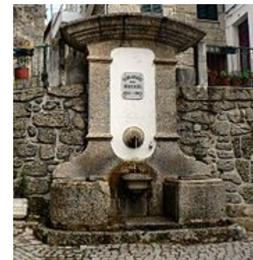
Fontanário em Loriga.

contrário do que aconteceu com a Covilhã (outra localidade serrana muito afectada), não chegou do governo de Lisboa qualquer auxílio.