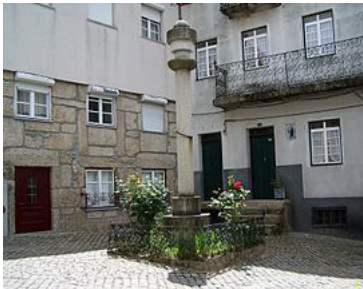
Largo do Pelourinho.