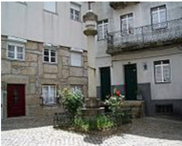
Largo do Pelourinho.