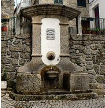
Fontanário em Loriga.

A rua da Oliveira é uma rua situada no centro histórico da vila. A sua escadaria tem cerca de 80 degraus em granito , o que lhe dá características peculiares. Esta rua recorda muitas das características urbanas medievais. O bairro de São Ginês é um bairro do centro histórico de Loriga cujas características o tornam num dos bairros mais típicos da vila. Curioso é o