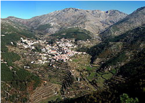
Vista panorâmica de Loriga e do vale glaciário com o mesmo nome, semelhante a uma paisagem alpina.

Loriga, situada na parte sudoeste da Serra da Estrela, encontra-se a 20 km de Seia, 80 km da Guarda e 320 km de Lisboa . A vila é acessível pela EN 231 e pela EN 338, estrada concluída em 2006, seguindo um traçado pré-existente, com um percurso de 9,2 km de paisagens de montanha, entre as cotas 960 m (Portela do Arão) e 1650 m, junto à Lagoa Comprida.