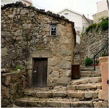
Rua da Oliveira, na área mais antiga do centro histórico