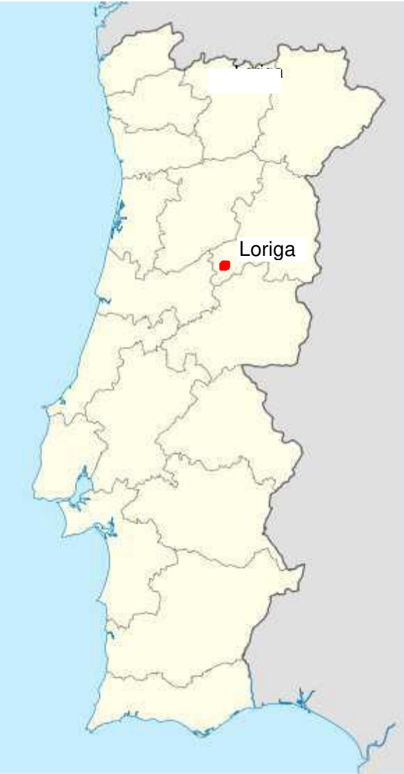
Localização de Loriga em Portugal