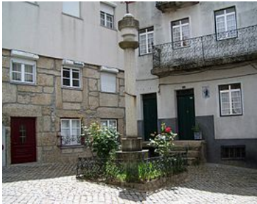
Largo do Pelourinho.