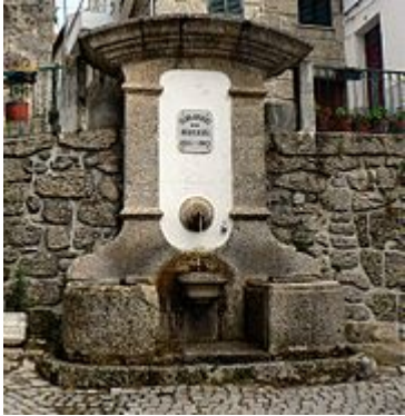
Fontanário em Loriga.

A rua da Oliveira é uma rua situada no centro histórico da vila. A sua escadaria tem cerca de 80 degraus em granito , o que lhe dá características peculiares. Esta rua recorda muitas das características urbanas medievais. O bairro de São Ginês é um bairro do centro histórico de Loriga cujas características o tornam num dos bairros mais típicos da vila. Curioso é o