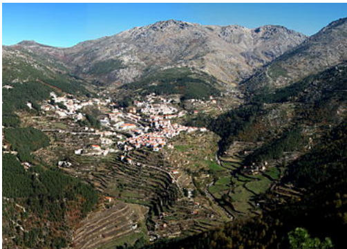
Vista panorâmica de Loriga e do vale glaciár com o mesmo nome, semelhante a uma paisagem alpina.

Loriga, situada na parte sudoeste da Serra da Estrela, encontra-se a 20 km de Seia, 80 km da Guarda e 320 km de Lisboa. A vila é acessível pela EN 231 e pela EN 338, estrada concluída em 2006, seguindo um traçado pré-existente e pré-projetado, com um percurso de 9,2 km de paisagens de montanha, entre as cotas 960 m (Portela de Loriga ou do Arão) e 1650 m, junto à Lagoa Comprida.