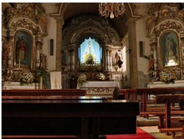
Igreja Matriz de Loriga, dedicada à padroeira da vila - vista interior.

Fundada originalmente no alto de uma colina entre ribeiras onde hoje existe o centro histórico da vila. O local foi escolhido há mais de dois mil e seiscentos anos devido à facilidade de defesa (uma colina entre ribeiras), à abundância de água e de pastos, bem como ao facto de a as terras mais baixas providenciarem alguma caça e condições mínimas para a prática da agricultura . Desta forma estavam garantidas as condições mínimas de sobrevivência para uma população e povoação com alguma importância.