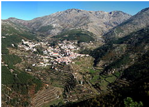
Vista panorâmica de Loriga e do vale glacial com o mesmo nome, semelhante a uma paisagem alpina.

Loriga, situada na parte sudoeste da Serra da Estrela, encontra-se a 20 km de Seia, 80 km da Guarda e 320 km de Lisboa. A vila é acessível pela EN 231 e pela EN 338, estrada concluída em 2006, seguindo um traçado pré-existente, com um percurso de 9,2 km de paisagens de montanha, entre as cotas 960 m (Portela do Arão) e 1650 m, junto à Lagoa Comprida.