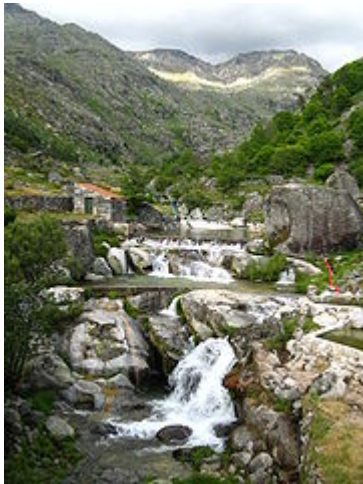
Praia fluvial de Loriga, no local conhecido há séculos por Chão da Ribeira".

no tempo do imperador Diocleciano, orago de uma ermida visigótica situada na área, no local onde hoje está a capela de Nossa Senhora do Carmo. Com o passar dos séculos os loriguenses mudaram o nome do santo para São Ginês. Este núcleo da povoação, que já esteve separado do principal e mais antigo, situado mais abaixo, é anterior à chegada dos romanos.