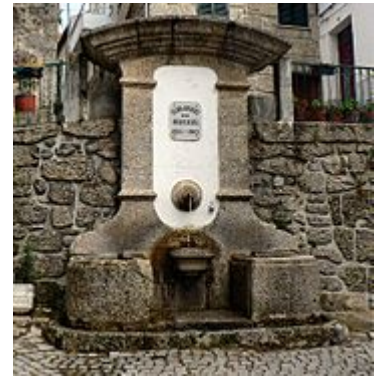
Fontanário em Loriga.

O sismo de 1755 provocou enormes estragos na vila, tendo arruinado também a residência paroquial e aberto algumas fendas nas robustas e espessas paredes do edifício da Câmara Municipal construído no século XIII. Um emissário do Marquês de Pombal esteve em Loriga a avaliar os estragos mas, ao contrário do que aconteceu com a Covilhã (outra localidade serrana muito afectada), não chegou do governo de Lisboa qualquer auxílio.