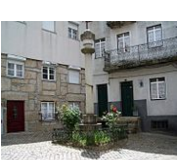
Largo do Pelourinho.