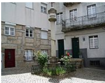
Largo do Pelourinho.

Loriga é uma vila industrial (têxtil) desde a primeira metade do século XIX , no entanto essa atividade já existia no século XIV em modo artesanal. Chegou a ser uma das localidades mais industrializadas da Beira Interior , e a actual sede de concelho só conseguiu suplantá-la quase em meados do século XX . Tempos houve em que só a Covilhã ultrapassava Loriga no número de empresas. Nomes de empresas, tais como: Regato, Redondinha, Fonte dos Amores, Tapadas, Fândega, Leitão & Irmãos, Augusto Luís Mendes, Lamas, Nunes Brito, Moura Cabral, Lorimalhas, etc, fazem parte da rica história industrial desta vila. A principal e maior avenida de Loriga tem o nome de Augusto Luís Mendes, o mais destacado dos antigos industriais loriguenses. Apesar dos maus acessos, que se resumiam à velhinha estrada romana de Loriga, com dois mil anos, o facto é que os loriguenses transformaram Loriga numa vila industrial.