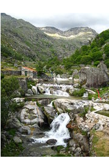
Praia fluvial de Loriga, no local conhecido há séculos por Chão da Ribeira".

A rua da Oliveira é uma rua situada no centro histórico da vila. A sua escadaria tem cerca de 80 degraus em granito, o que lhe dá características peculiares. Esta rua recorda muitas das características urbanas medievais. O bairro de São Ginês é um bairro do centro histórico de Loriga cujas características o tornam num dos bairros mais típicos da vila. Curioso é o facto de este bairro dever o nome a São Gens , um santo de origem céltica martirizado em Arles, na Gália, no tempo do imperador Diocleciano, orago de uma ermida visigótica situada na área, no local onde hoje está a capela de Nossa Senhora do Carmo. Com o passar dos séculos os loriguenses mudaram o nome do santo para São Ginês. Este núcleo da povoação, que já esteve separado do principal e mais antigo, situado mais abaixo, é anterior à chegada dos romanos.