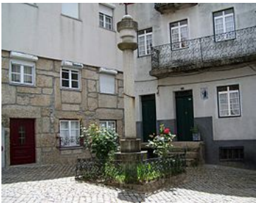
Largo do Pelourinho.