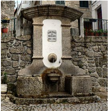
Fontanário em Loriga, um dos três construídos pela comunidade loriguense de Manaus.

A partir de meados do século XIX tornou-se um dos principais pólos industriais da Beira Alta, com desenvolvimento da indústria dos lanifícios, que entrou em declínio durante as últimas décadas do século passado o que está a levar à desertificação da Vila, facto que afecta de maneira geral as regiões interiores de Portugal devido às inexistentes políticas locais e nacionais de coesão territorial. Actualmente a economia loriguense baseia-se nas indústrias metalúrgica e de panificação, no comércio, restauração, malhas, alguma agricultura e pastorícia.