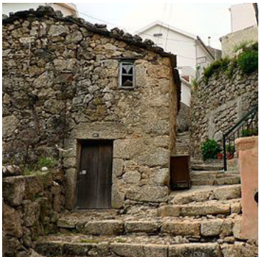
Rua da Oliveira