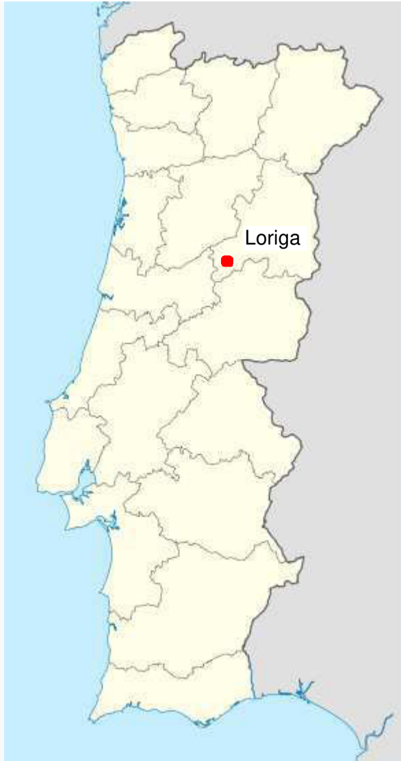
Localização de Loriga em Portugal