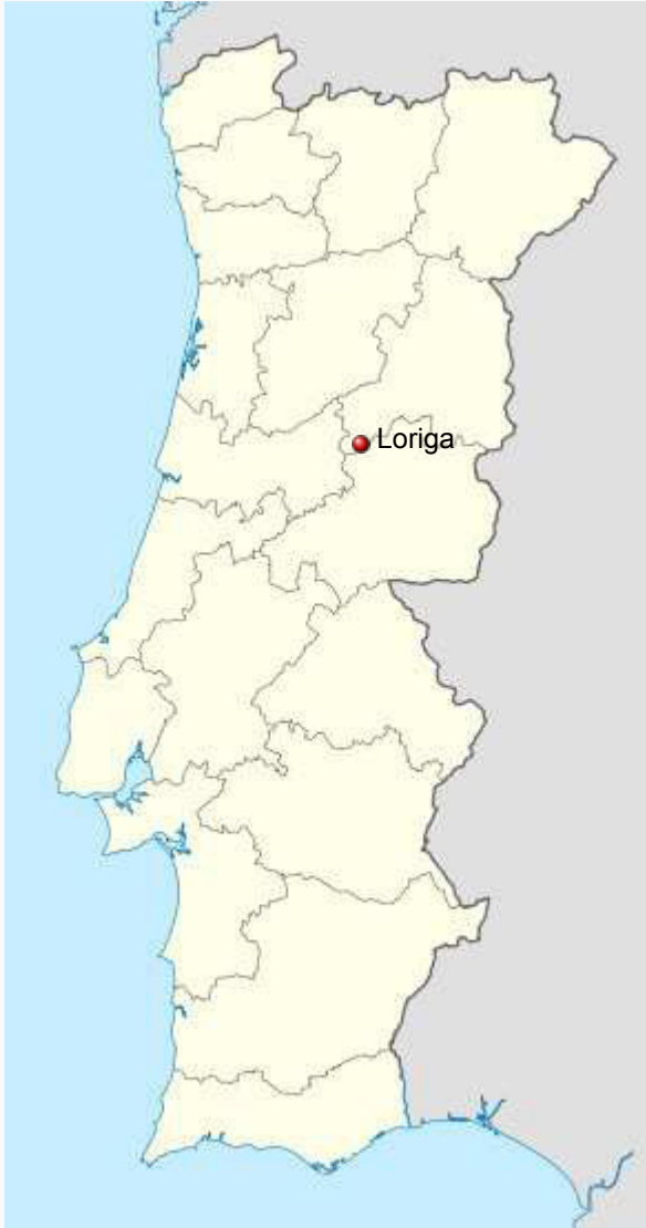
Localização de Loriga em Portugal