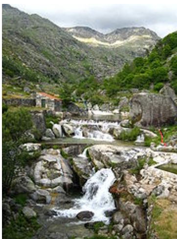
Praia fluvial de Loriga, no local conhecido há séculos por Chão da Ribeira".