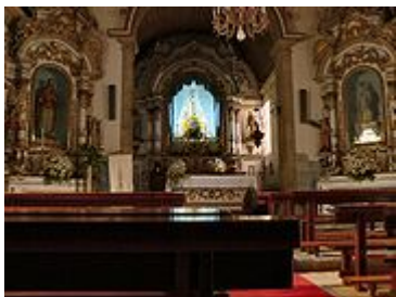
Igreja Matriz de Loriga - vista interior.

Loriga, antiga paróquia criada pelos visigodos, era uma paróquia pertencente à Vigararia do Padroado Real e a Igreja Matriz foi mandada construir em 1233 pelo rei D. Sancho II . Esta igreja, cujo orago era já o de Santa Maria Maior e que se mantém, foi construída no local de outro antigo e pequeno templo, do qual foi aproveitada uma pedra com inscrições visigóticas, que está colocada na porta lateral virada para o adro. De estilo românico, com três naves, e traça exterior lembrando a Sé Velha de Coimbra, esta igreja foi destruída pelo sismo de 1755 , dela restando apenas partes das paredes laterais.