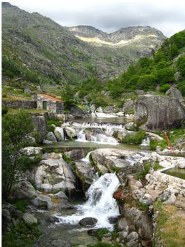
Praia fluvial de Loriga, no local conhecido há séculos por Chão da Ribeira.

A rua da Oliveira é uma rua situada no centro histórico da vila. A sua escadaria tem cerca de 80 degraus em granito , o que lhe dá características peculiares. Esta rua recorda muitas das características urbanas medievais. O bairro de São Ginês é um bairro do centro histórico de Loriga cujas características o tornam num dos bairros mais típicos da vila. Curioso é o facto de este bairro dever o nome a São Gens , um santo de origem céltica martirizado em Arles, na Gália, no tempo do imperador Diocleciano, orago de uma ermida visigótica situada na área, no local onde hoje está a capela de Nossa Senhora do Carmo. Com o passar dos séculos os loriguenses mudaram o nome do santo para São Ginês, deixaram arruinar a sua capela e depois reconstruíram-na com outro orago (Nossa Senhora do Carmo). Este núcleo da povoação, que já esteve separado do principal e mais antigo, situado mais abaixo, é também anterior à chegada dos romanos.