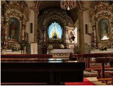
Igreja Matriz de Loriga - vista interior.

igreja, cujo orago era já o de Santa Maria Maior e que se mantém, foi construída no local de outro antigo e pequeno templo, do qual foi aproveitada uma pedra com inscrições visigóticas, que está colocada na porta lateral virada para o adro. De estilo românico, com três naves, e traça exterior lembrando a Sé Velha de Coimbra, esta igreja foi destruída pelo sismo de 1755 , dela restando apenas partes das paredes laterais.