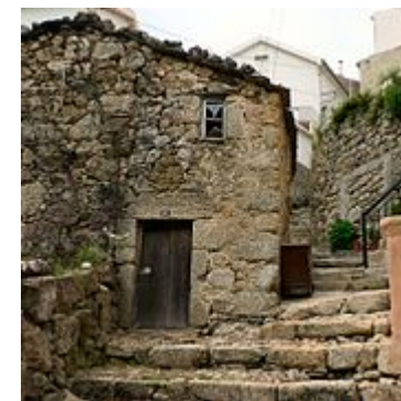
Rua da Oliveira

A rua da Oliveira é uma rua situada no centro histórico da vila. A sua escadaria tem cerca de 80 degraus em granito, o que lhe dá características peculiares. Esta rua recorda muitas das características urbanas medievais. O bairro de São Ginês é um bairro do centro histórico de Loriga cujas características o tornam num dos bairros mais típicos da vila. Curioso é o facto de este bairro dever o nome a São Gens , um santo de origem céltica martirizado em Arles, na Gália, no tempo do imperador Diocleciano, orago de uma ermida visigótica situada na área, no local onde hoje está a capela de Nossa Senhora do Carmo. Com o passar dos séculos os loriguenses mudaram o nome do santo para São Ginês. Este núcleo da povoação, que já esteve separado do principal e mais antigo, situado mais abaixo, é anterior à chegada dos romanos.