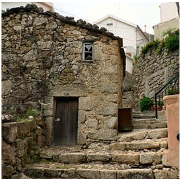
Rua da Oliveira, na área mais antiga do centro histórico