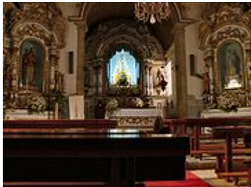
Igreja Matriz de Loriga - vista interior.

Uma tradição muito antiga e documentada, aponta Loriga como berço de Viriato, e já houve na vila um projecto que não chegou a concretizar-se, para erigir um monumento a este herói lusitano.