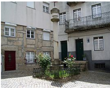
Largo do Pelourinho.