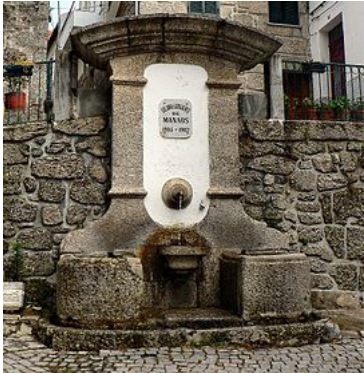
Fontanário em Loriga.

O sismo de 1755 provocou enormes estragos na vila, tendo arruinado também a residência paroquial e aberto algumas fendas nas robustas e espessas paredes do edifício da Câmara Municipal construído no século XIII. Um emissário do Marquês de Pombal esteve em Loriga a avaliar os estragos mas, ao contrário do que aconteceu com a Covilhã (outra localidade serrana muito afectada), não chegou do governo de Lisboa qualquer auxílio.