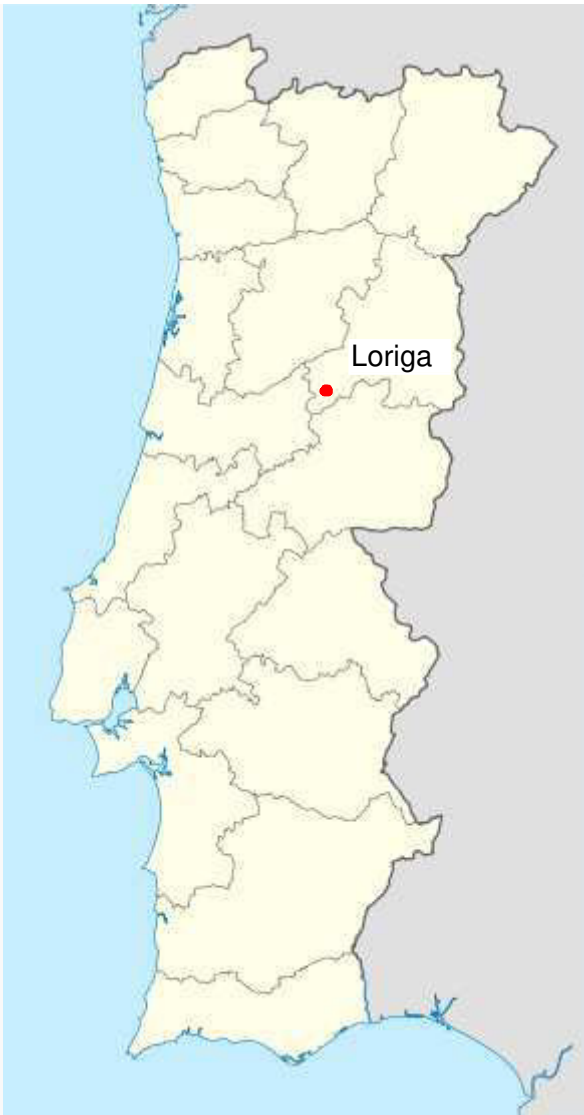
Localização de Loriga em Portugal