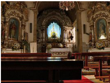
Igreja Matriz de Loriga - vista interior.

Fundada originalmente no alto de uma colina entre ribeiras onde hoje existe o centro histórico da vila. O local foi escolhido há mais de dois mil anos devido à facilidade de defesa (uma colina entre ribeiras), à abundância de água e de pastos, bem como ao facto de a as terras mais baixas providenciarem alguma caça e condições mínimas para a prática da agricultura . Desta forma estavam garantidas as condições mínimas de sobrevivência para uma população e povoação com alguma importância.