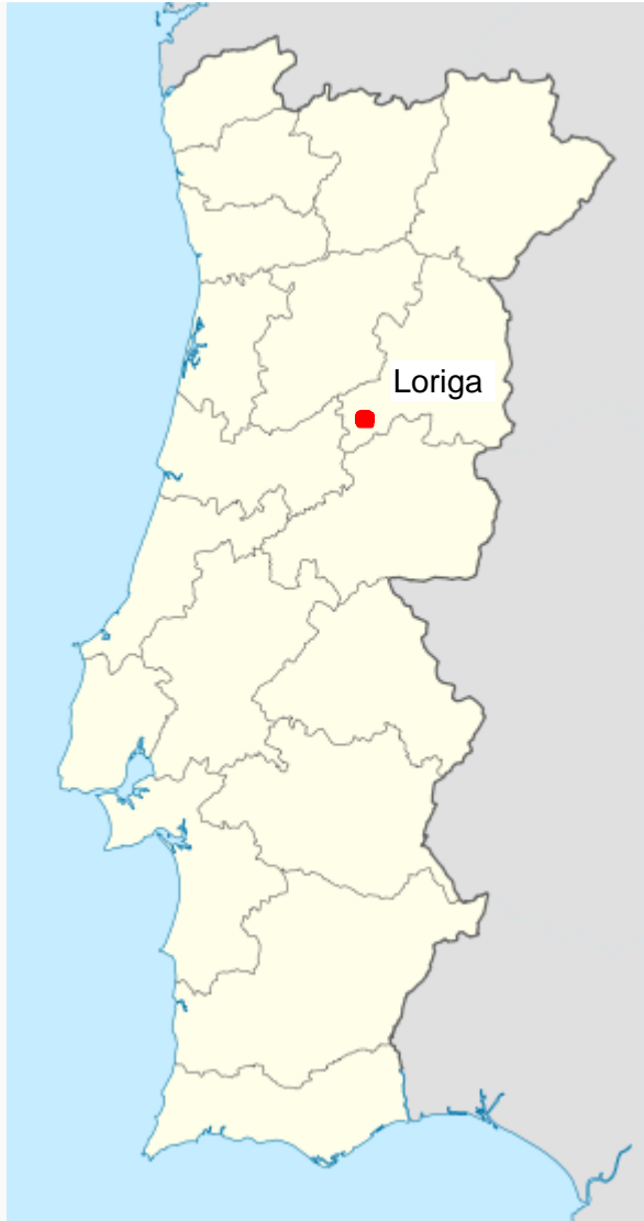
Localização de Loriga em Portugal