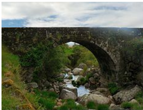
A ponte romana da época restante atravessando a Ribeira de Loriga

Loriga foi fundada ao longo de uma colina entre ravinas onde hoje existe o centro histórico. O site foi ostensivamente selecionado mais de 2600 anos atrás, devido à sua defensibilidade, a abundância de água e pastagens potável e terras baixas que forneceu condições para praticar a caça e coleta / agricultura.