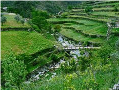
A bridge over a ravine in Loriga, with the pastures of the valley landscape

Known locally as the " Portuguese Switzerland " due to its landscape that includes a principal settlement nestled in the mountains of the Serra da Estrela Natural Park. [3] It is located in the south-central part of the municipality of Seia, along the southeast part of the Serra, between several ravines, but specifically the Ribeira de São Bento and Ribeira da Nave; [3] it is 20 kilometres from Seia, 80 kilometres from Guarda and 300 kilometres from the national capital (Lisbon). A main town is accessible by the national roadway E.N. 231, that connects directly to the region of the Serra da Estrela by way of E.N.338 (which was completed in 2006), or through the E.N.339, a 9.2 kilometre access that transits some of the main