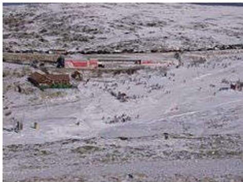
Vodafone Ski Resort, Serra da Estrela, in the town of Loriga.