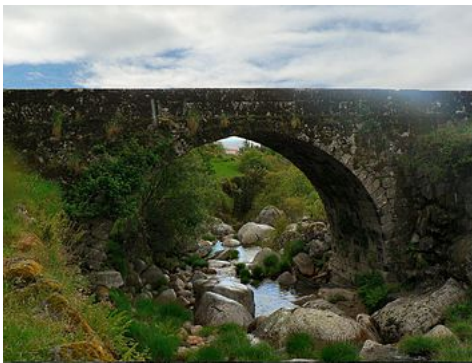
The original Roman-era bridge crossing the Ribeira de Loriga

Loriga was founded along a column between ravines where today the historic centre exists. The site was ostensibly selected more than 2000 years ago, owing to its defensibility, the abundance of potable water and pasturelands, and lowlands that provided conditions to practice both hunting and gathering/agriculture.