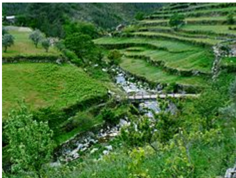
Uma ponte sobre uma ravina em Loriga, com as pastagens da paisagem vale

A região é esculpido por vales glacial em forma de U, modeladas pelo movimento de geleiras antigas. O vale principal, Vale de Loriga foi entalhada por abrasão longitudinal que também criou bolsos arredondados, onde a resistência glacial foi menor. A partir de uma altitude de 1991 metros ao longo da Serra da Estrela o vale desce abruptamente até 290 metros acima do nível do mar (cerca de Vide), passando aldeias, como Cabeça, Casal do Rei e Muro. A cidade central, Loriga, é de sete quilômetros da Torre (o ponto mais alto), mas a paróquia é esculpida por falésias, planícies aluviais e lagos glaciais depositados durante milênios de erosão glacial, e rodeado por floresta antiga rara que rodeava os flancos laterais destes geleiras.