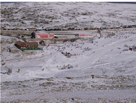
Vodafone Ski Resort, Serra da Estrela, in the town of Loriga.

Textiles are the principal local export; Loriga was a hub the textile and wool industries during the beginning-19th century, in addition to being subsistence agriculture responsible for the cultivation of corn. The Loriguense economy is based on metallurgical industries, bread-making, commercial shops, restaurants and agricultural support services.