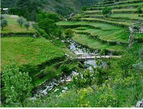
A bridge over a ravine in Loriga, with the pastures of the valley landscape

Known locally as the " Portuguese Switzerland " due to its landscape that includes a principal settlement nestled in the mountains of the Serra da Estrela Natural Park. [3] It is located in the south-central part of the municipality of Seia, along the southeast part of the Serra, between several ravines, but specifically the Ribeira de São Bento and Ribeira de Loriga; [3] it is 20 kilometres from Seia, 80 kilometres from Guarda and 300 kilometres from the national capital (Lisbon). A main town is accessible by the national roadway E.N. 231, that connects directly to the region of the Serra da Estrela by way of E.N.338 (which was completed in 2006), or through the E.N.339, a 9.2 kilometre access that transits some of the main elevations (960 metres near Portela do Arão or Portela de Loriga, and 1650 metres around the Lagoa Comprida).