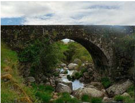
The remaining Roman-era bridge crossing the Ribeira de Loriga

Loriga was founded along a column between ravines where today the historic centre exists. The site was ostensibly selected more than 2000 years ago, owing to its defensibility, the abundance of potable water