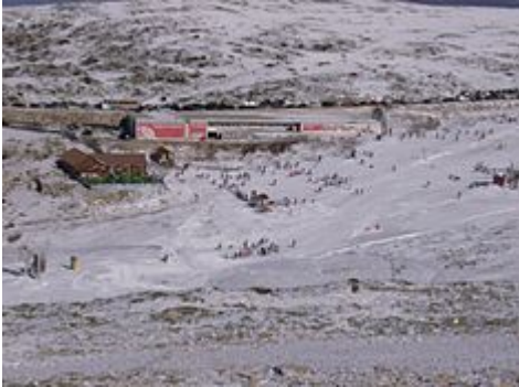
Vodafone Ski Resort , Serra da Estrela , na cidade de Loriga.

Têxteis são o principal produto de exportação local; Loriga foi um hub os têxteis e lã indústrias durante a meados do século 19, além de ser a agricultura de subsistência responsáveis pelo cultivo de milho. A economia Loriguense é baseada em indústrias metalúrgicas, panificação, lojas comerciais, restaurantes e serviços de apoio à agricultura.