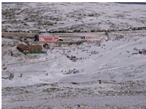
Vodafone Ski Resort , Serra da Estrela , na cidade de Loriga.

Têxteis são o principal produto de exportação local; Loriga foi um hub os têxteis e lã indústrias durante a meados do século 19, além de ser a agricultura de subsistência responsáveis pelo cultivo de milho. A economia Loriguense é baseada em indústrias metalúrgicas, panificação, lojas comerciais, restaurantes e serviços de apoio à agricultura.